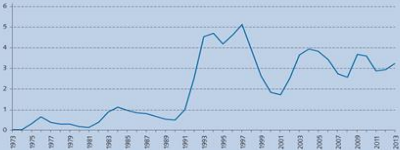
Abb. 1.3 Arbeitslosenquote in der Schweiz 1973–2013 (in Prozent)